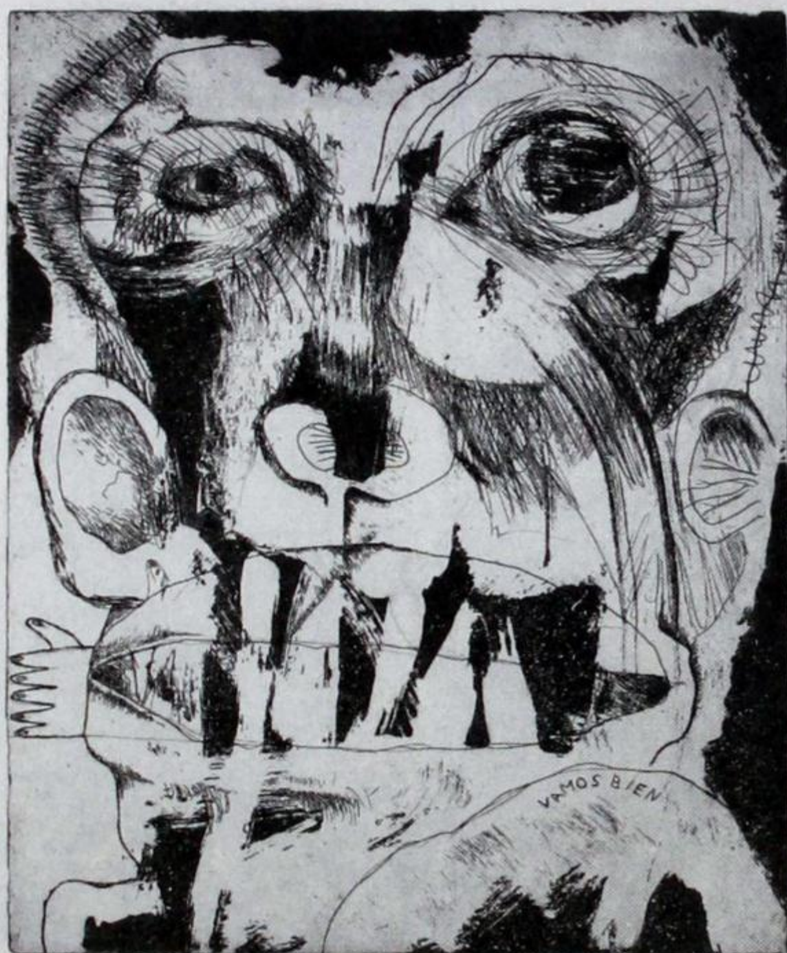
—PIEZA EN FORMA DE PEDA II—

La poesía no se escribe porque no se tiene nada mejor que hacer. Haber reemplazado a los poetas por poéticas llevó a la sustitución de los poemas por poemitas. La belleza no es para todos. Sólo para quienes pueden apreciarla. Cuenta el libro que, en años recientes, existió en Manizales La banda de los cuatro , que se hacían llamar POETAS TÓXICOS . Vomitaron facilito (en un folleto) las pocas toxinas que tenían, y desaparecieron. Dónde están ahora, se pregunta el autor.